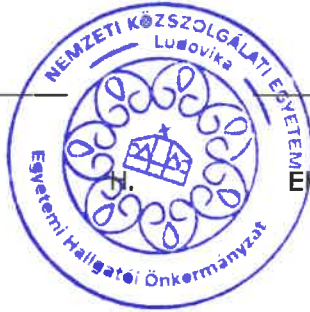
Epresi Ádám jegyzőkönyvvezető EHÖK adminisztrációs referens

Készült: 1 eredeti példányban 1 példány: 2 lap (3 oldal) Ügyintéző: Epresi Ádám (EHÖK adminisztrációs referens) Elérhetőség: epresi.adam@uni-nke.hu | Kapják: 1. sz. eredeti példány: NKE EHÖK Irattár 2. sz. (elektronikus) példány: NKE Oktatási és Tanulmányi Iroda